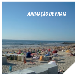
ANIMAÇÃO DE PRAIA