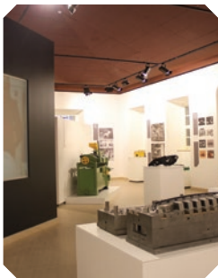
EXPOSIÇÃO ESCULPIR O AÇO Iniciativa da Câmara Municipal e da CEFAMOL – Associação Nacional da Indústria de Moldes.

Horário: terça-feira a domingo, das 10h00 às 18h00 Entrada gratuita