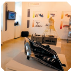
COLEÇÃO VISITÁVEL DO FUTURO MUSEU DA INDÚSTRIA DE MOLDES Edifício da Resinagem