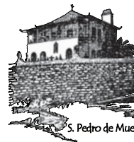
onde a terra se acaba e o mar começa

Integra ainda um circuito museológico de interpretação de bens culturais aplicados nos vários edifícios (azulejaria e cantaria), relacionando-os com a vida e obra do escritor.