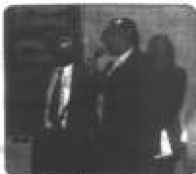
Câmara premia desportistas.