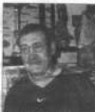
O presidente Hélder Latta

São 22 o número de pescadores que participam nas provas de pesca de rios e de mar, mas Hélder Latta, considera que os apoios são escassos. «É um desporto dispendioso. Mas desportivo-