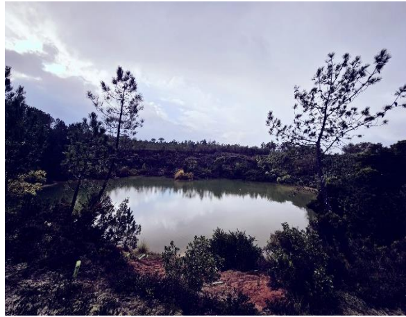
Pedreira de argila explorada pela Cerâmica Vitória, Lda | 1968 | Casal da Lebre

A Mata Nacional do Casal da Lebre (MNCL) estende-se por 370 hectares e está arborizada numa superfície de 281 hectares, tendo como espécie principal o pinheiro-bravo (que ocupa 76% da área da Mata), sendo a restante área ocupada com folhosas diversas que existem ao longo das linhas de água e dos caminhos.